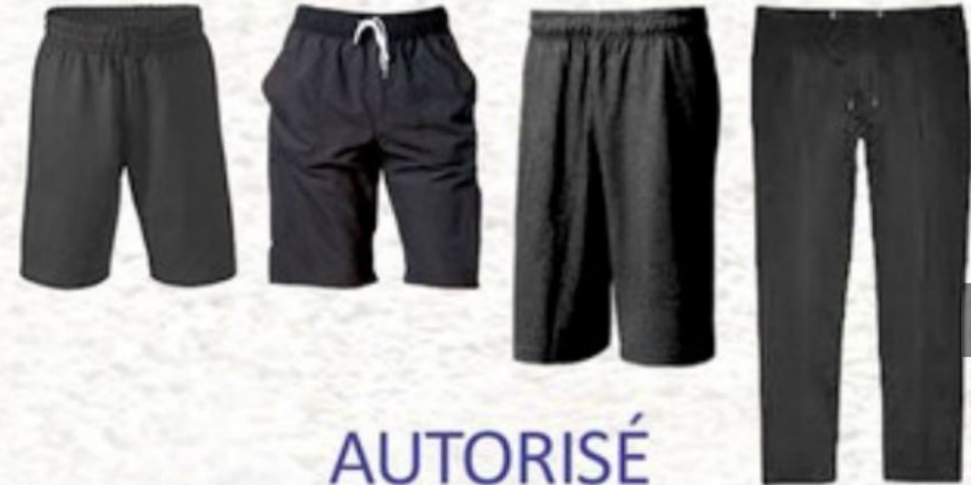
Modèle et couleur identiques