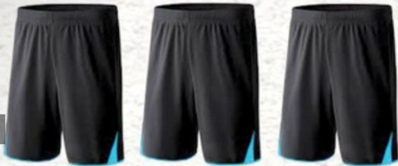
Modèle et couleur identiques